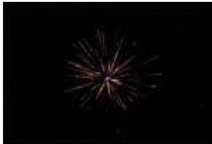
PIETRO PENNESTI 1