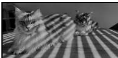
JOLANDA MUHLENBAUMER 20