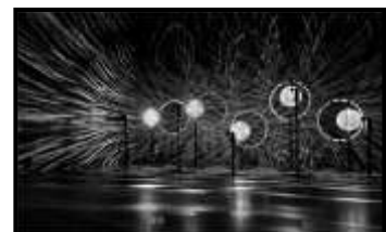
STEVEN LEUNG 40