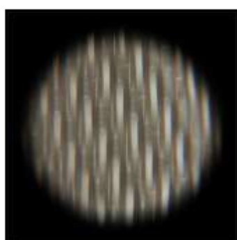
WILMY ROELOFS 3