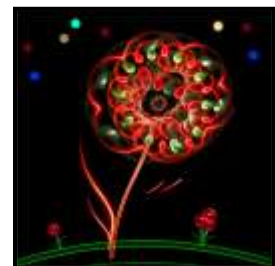
GEJA PUNTE 44