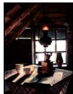
FRED VEENKAMP 23