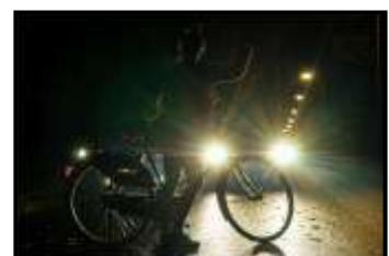
LOURENS HUIZINGA 33