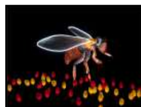
ESTER PETERINK 2