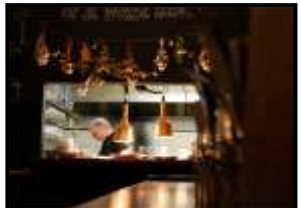
MABEL EGBERINK 1