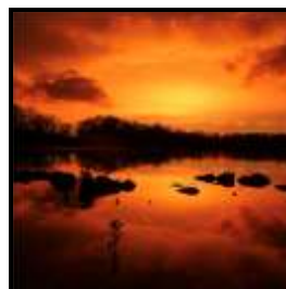
LENIE VAN DEN DOEL 5