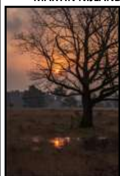
HILDA BOOIJ 3