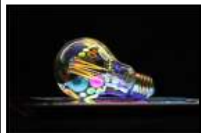
ESTHER REINK 20